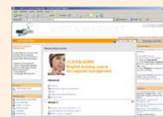
Multilinguale Informations- und Wissensportale