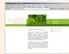
e-Learning & Wissenstransfer